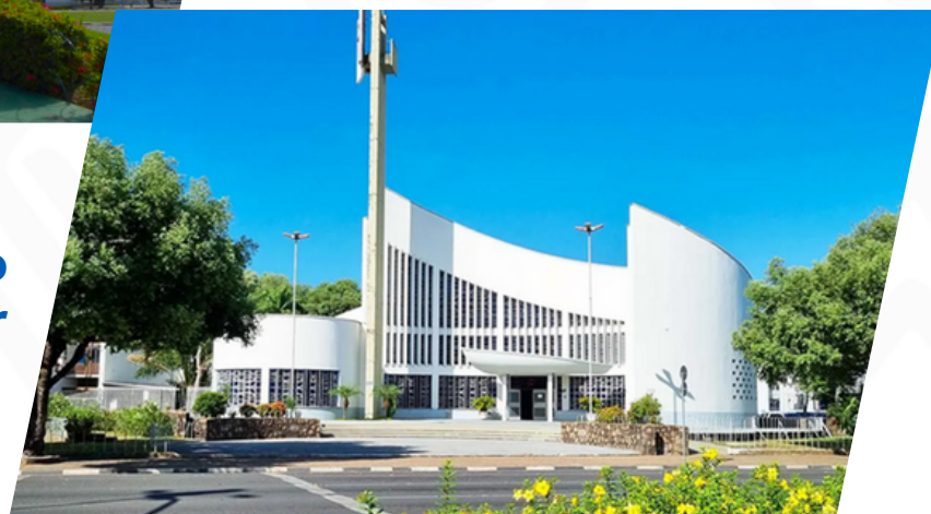
Igreja Catedral Cristo Redentor