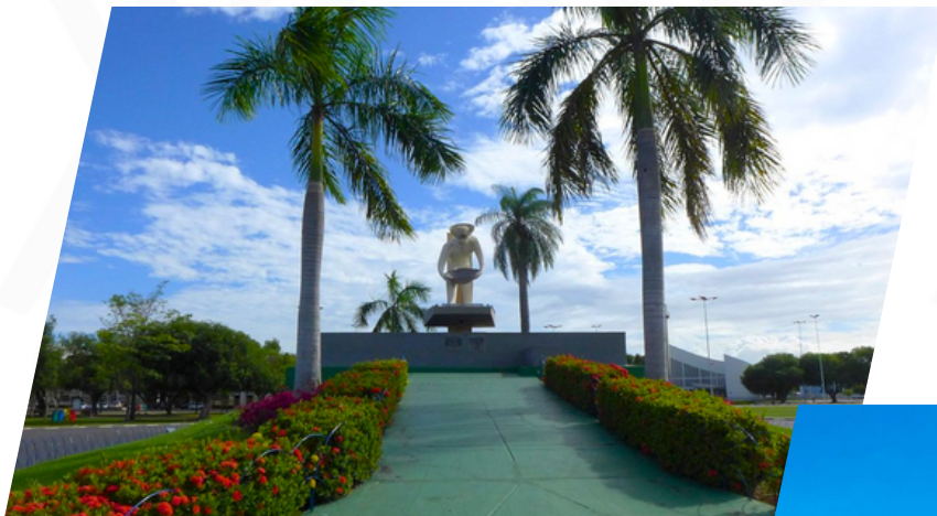
Monumento ao Garimpeiro

A Praça do Centro Cívico fica em um espaço aberto e tem alguns pontos culturais que valem uma visita, como o Monumento ao Garimpeiro, a Catedral Cristo Redentor e o Palácio da Cultura Nenê Macaggi.