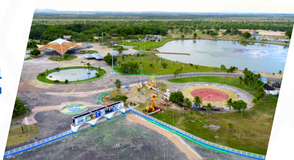
Imagen aérea del Parque Anauá

Tiene un área para eventos, canchas deportivas, lugares para caminar y andar en bicicleta y un lago, sin embargo, el parque está un poco descuidado y debería ser revitalizado. Está cerca del aeropuerto de Boa Vista RR.