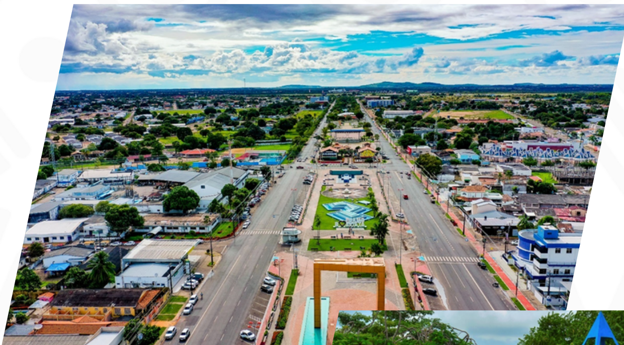
Imagen aérea del complejo con vistas a la Praça das Águas y al Portal del Milenio

El complejo alberga la Praça das Águas y el Portal del Milenio, la Praça do Picote, la Praça Velia Coutinho, la Praça Fábio Paracat y la Praça da Pirâmide. En otras palabras: ¡diversión, ocio y entretenimiento no faltan!