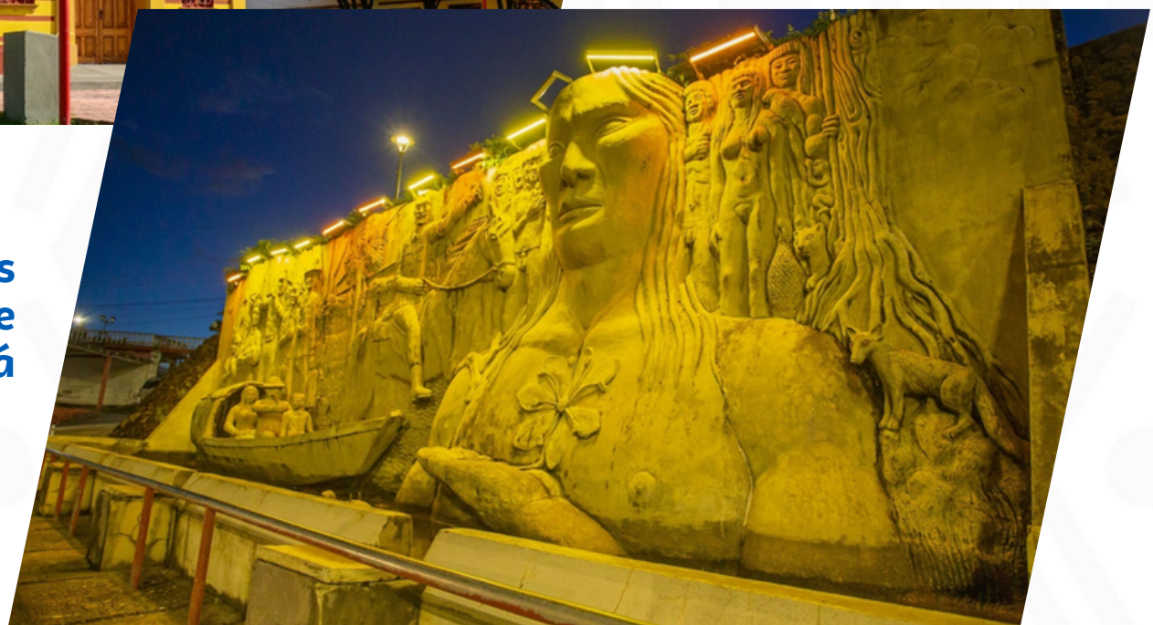
Monumento a los Pioneros, obra de Luiz Canará