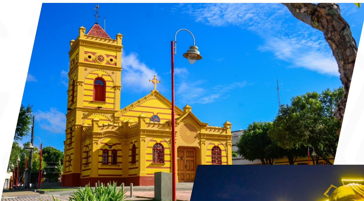
Iglesia Nuestra Señora del Carmen

Donde comenzó la ciudad, en la década de 1830, cuando era sólo una hacienda a orillas del Río Branco. Allí encontrará la Igreja Matriz Nossa Senhora do Carmo, el Restaurante Meu Cantinho (antigua sede de la Fazenda Boa Vista, que dio origen a la ciudad) y el edificio de la Intendência (réplica del primer "ayuntamiento"). El Monumento a los Pioneros y la Praça Barreto Leite complementan el conjunto histórico.