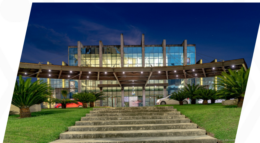
Teatro Municipal de Boa Vista

Considerado uno de los más grandes de Brasil, tiene arquitectura moderna, con vestíbulo, sala principal de espectáculos (Roraimeira), con capacidad para 1.100 personas y una sala para eventos menores, el Teatro Escola, con 166 butacas. Además, el espacio cuenta con un sistema de energía solar, con 2.880 paneles fotovoltaicos en el aparcamiento. Allí todavía se puede tomar una copa, hay una elegante cafetería situada dentro del Teatro.