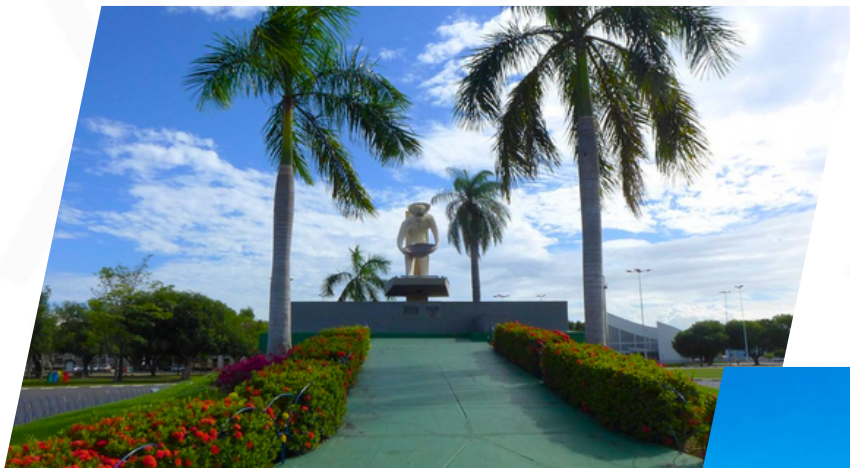
Monumento al Garimpeiro

La Plaza del Centro Cívico es un espacio abierto y cuenta con algunos puntos culturales que valen la pena visitar, como el Monumento Garimpeiro, la Catedral del Cristo Redentor y el Palacio de la Cultura Nenê Macaggi.