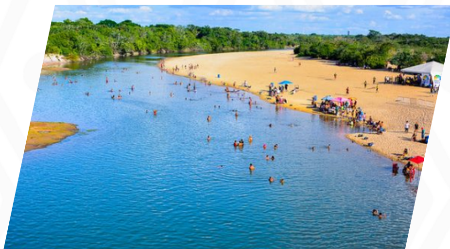
Vista aérea de la Praia da Polar

Praia da Polar está a orillas del río Cauamé. Está en una zona forestal más cerrada donde el río es más estrecho. Cuando el río está alto la playa prácticamente desaparece. Se encuentra a 7 km del centro.