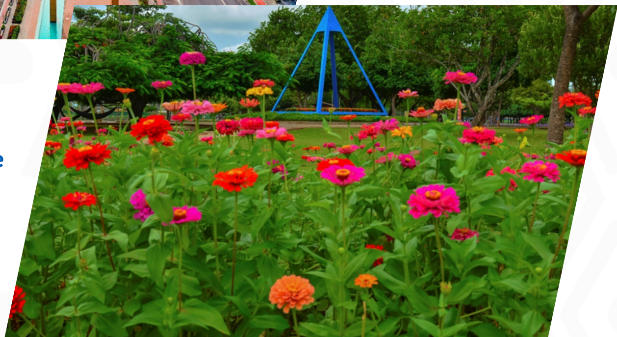
Plaza de la Pirámide